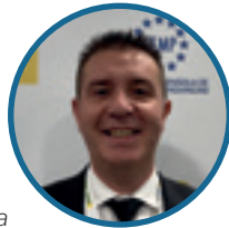
SANTIAGO CABAÑERO, Presidente de la Diputación de Albacete

Somos esa España que produce el aire que respiramos, somos esa España que produce los alimentos. Somos esa España con nuestro sector agroalimentario cada vez más tecnificado, más modernizado. Somos esa España que aportamos esa buena vecindad, que aportamos esa calidad de vida. Tenemos que legislar de manera distinta, realidades que son diferentes...; si somos capaces de legislar de manera diferenciada realidades que son distintas, estas potencialidades se van a convertir seguro en oportunidades.