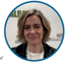
TERESA LÓPEZ, Presidenta de FADEMUR

La despoblación puede convertirse en una oportunidad siempre que contemos con las mujeres. Somos imprescindibles para que los pueblos tengan futuro, somos el motor de cambio, el motor del emprendimiento y la innovación; de apuesta, de entender el rural de otra manera, más inclusiva, más cohesionada, escuchándonos.