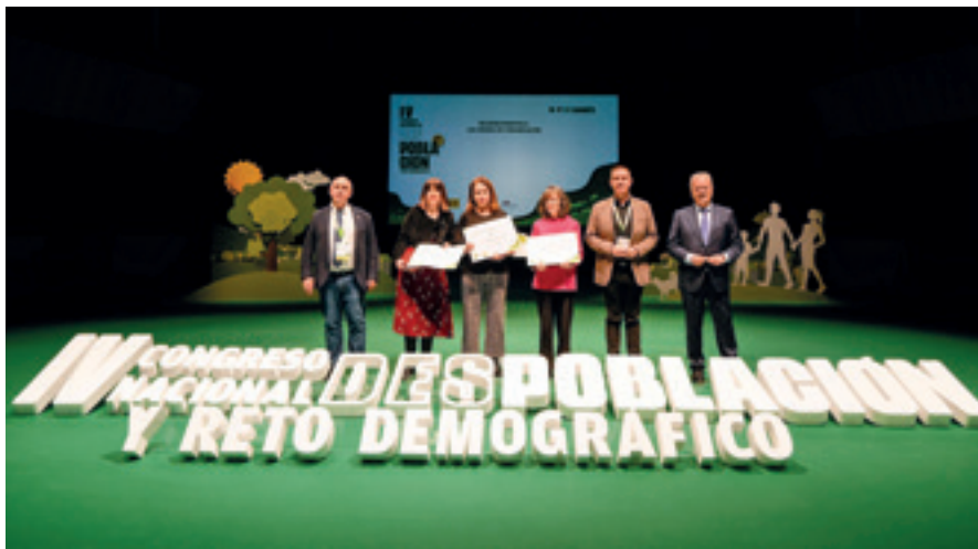
Varios medios de comunicación recibieron el reconocimiento del Congreso.

nacionales, autonómicas y locales, y manifestó que todas las Administraciones Públicas saben que el reto demográfico ha de formar parte de las actuaciones de su día a día y de forma transversal, y que los ciudadanos también han de entender que se trata de un tema prioritario. La Ministra también se refirió a los avances en materia de conectividad, servicios y apoyo a la movilidad, los avances en materia energética y el despliegue de infraestructuras.