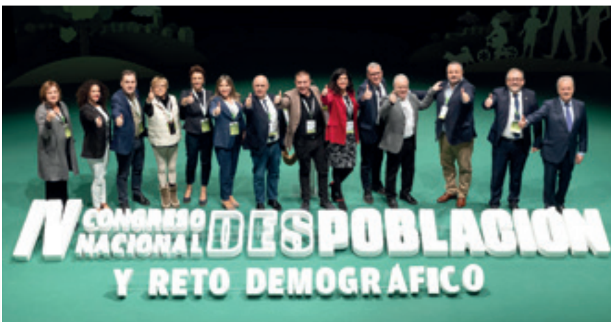
Imagen de la clausura del Congreso.

A los responsables locales y a cuantos se enfrentan al reto les recomendó no obsesionarse con la demografía ni con los datos y no olvidar que "hay lugares que nunca han tenido mucha población. Lo que necesitamos es recuperar la calidad demográfica, comunidades vivas, donde las personas que quieran vivir allí puedan hacerlo" . Y en ese camino también es precisa la complicidad con el medio urbano porque "el medio urbano no va a tener futuro si no hay un medio rural vivo" .