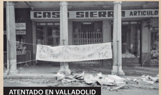
ATENTADO EN VALLADOLID

Un mes de enero el del 1981 en el que se crea la FEM, la Federación Española de Municipios. La P de Provincias llegaría más tarde. De momento es la FEM y como tal se registra. La gestación, sin embargo, había comenzado un año antes, en enero del 80; y el nacimiento sería en junio de este 1981, en Torremolinos.