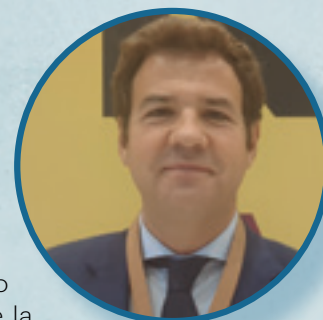
José de la Uz Alcalde de Las Rozas

“La Agenda Urbana ha sido un instrumento de planificación muy importante y de estrategia para transformar nuestro municipio. Los pilares en los que se basa son fundamentalmente aplicar un Plan de Movilidad Urbana Sostenible, gracias también a las iniciativas como el transporte a la demanda; el abastecimiento de agua, la eficiencia energética y la creación de comunidades energéticas y la renaturalización de espacios y la regeneración de espacios urbanos”.