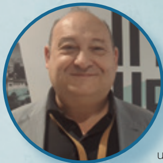
Carles Ruiz Alcalde de Viladecans

“La Agenda Urbana es un cambio total en la visión de cómo planear la ciudad, es tener en cuenta que no es solo el urbanismo, que hay muchos elementos transversales desde el punto de vista social, desde el punto de vista de los espacios abiertos, del uso de los espacios públicos: es una manera diferente de concebir la evolución de las ciudades”.