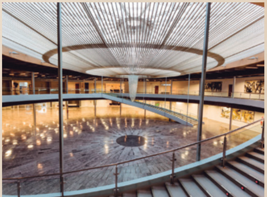
Hall Principal del Palacio de Congresos de Torremolinos, que acogerá los principales actos del 40 Aniversario.

de la entonces Federación Española de Municipios. Aquella primera Asamblea, inicio de -por ahora- 40 años de historia, con sus detalles, momentos, imágenes y testimonios de primera mano de quienes allí estuvieron, la hemos ido recordando a lo largo del año en anteriores números de Carta Local y en la web de la conmemoración, http://40aniversario.femp.es/ , compaginándolo con conversaciones con Alcaldes y Alcaldesas que han cumplido 40 años de edad en este 2021, nacidos con la FEMP o Generación FEMP les hemos llamado y, además de recordar cuándo, cómo y por qué les dio por la política local, han reflexionado sobre cómo debería ser el municipalismo que viene.